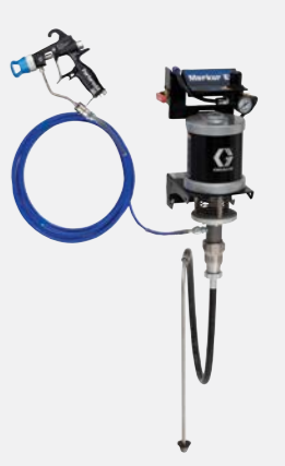
30:1 airless wandmontage