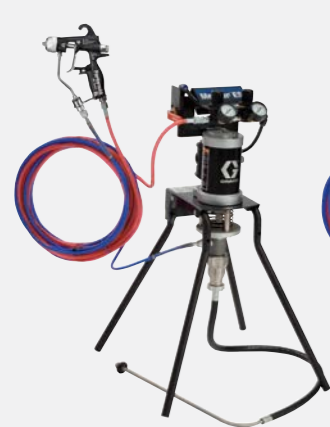
15:1 luchtondersteund montage op standaard