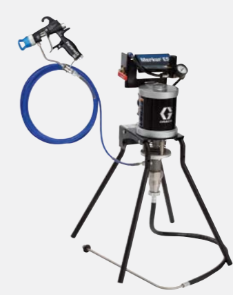
30:1 airless montage op standaard